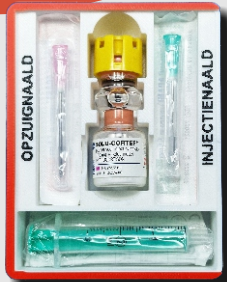
Exclusief medische materialen