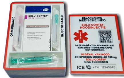
De prik-instructie is een product van AdrenalNET